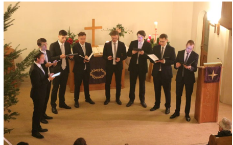
Konzert „in voce veritas“