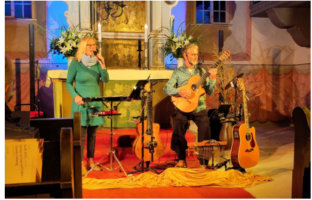
Liebethaler Grundton DUO LIASONG