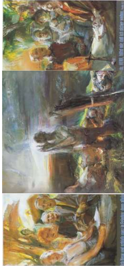
Johannes Heisig - Das Gelliehäuser Altarbild, Tempera und Öl auf Leinwand 2001/2002

Der Herr segne dich und behüte dich. Der Herr lasse sein Angesicht leuchten über dir und sei dir gnädig. Der Herr erhebe sein Angesicht auf dich und gebe dir + Frieden. G Amen.