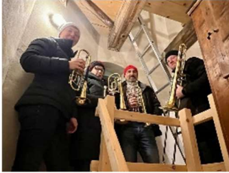
(die Bläser im Kirchturm zum Adventskalender am 5. Dezember)

Es sind ca.1200 € zusammengekommen von denen wir 600 € nach Palästina zu Brass for Peace überweisen. Den restlichen Teil nutzen wir für unseren Posaunenchor (Probenwochenende im Kloster Marienthal, Kauf neuer Noten, Instrumentenpflege, Zubehörfpflege u.v.a.m.).