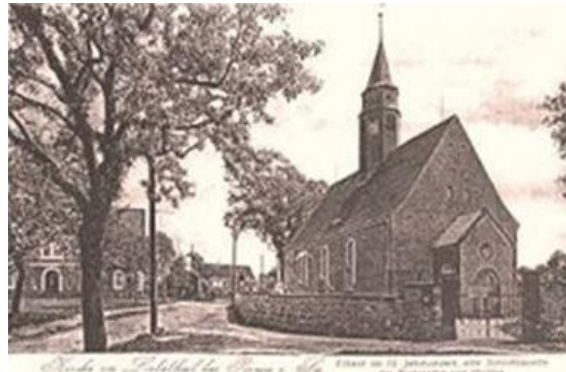
Die erste Erwähnung von Liebenthal erfolgte in der „Oberlausißischen Grenzurkunde“

von 1213/1241. „Henricus de Libendal“ wird jedoch erst in dem wohl 1241 hinzugekommenen Teil erwähnt (Schiffner).