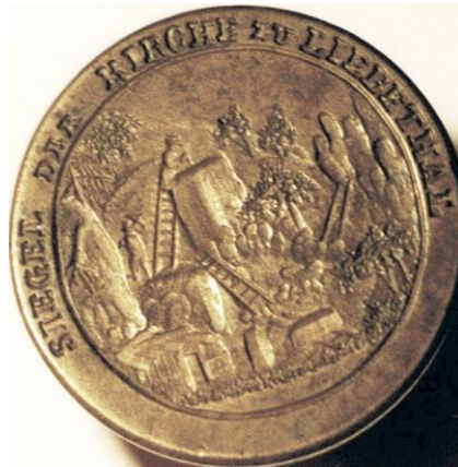
„Siegel der Kirche zu Liebenthal“.

In der „Steinbrecherfürbitte der Kirche von Liebenthal“ von 1814 heißt es: